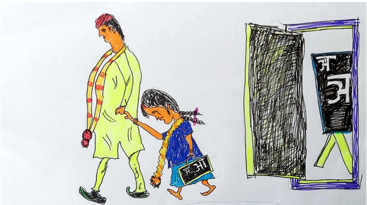
Foto 7. Spose bambine