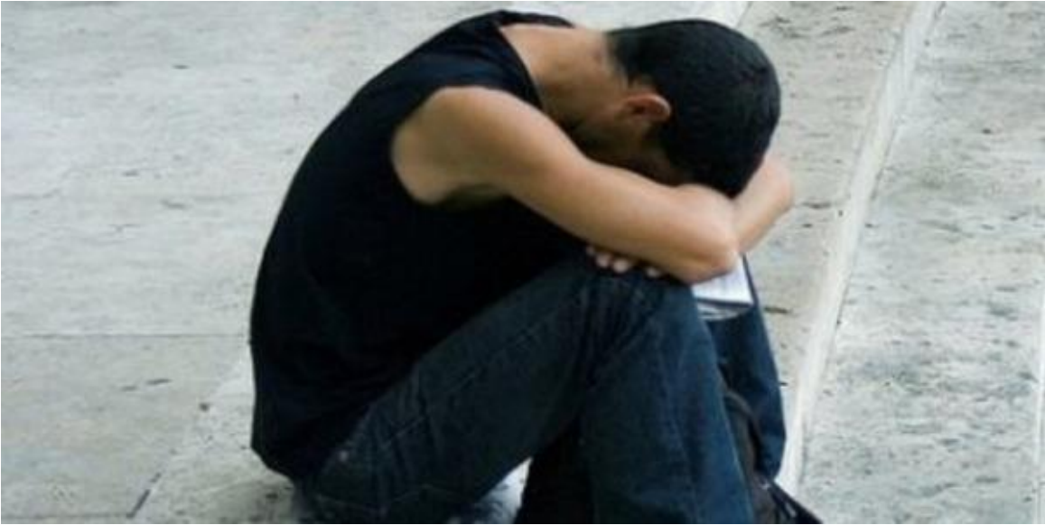
Foto 10.11 terremoto