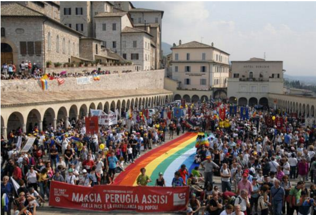
Foto 4. Marcia della pace