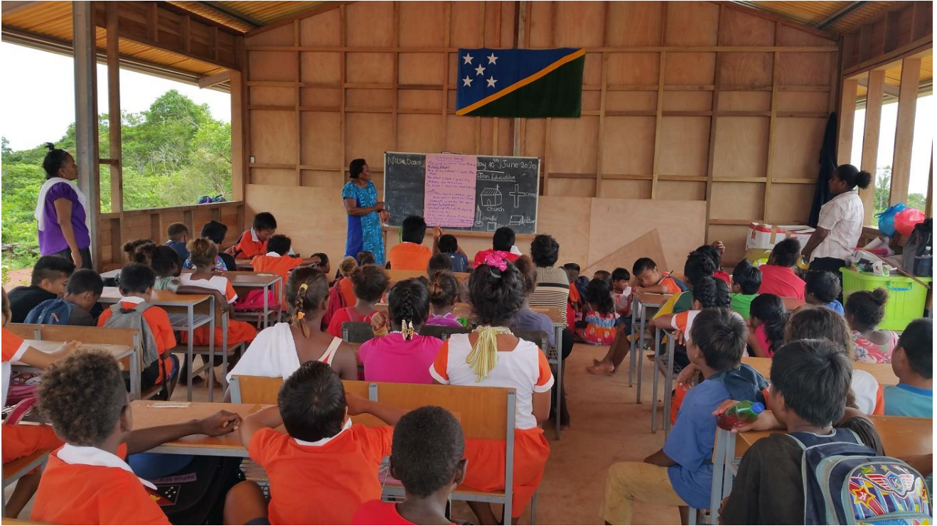
Foto 7 e 8. Caritas Siria