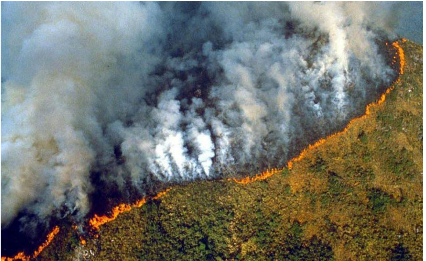
Foto 3. Incendi in Amazzonia