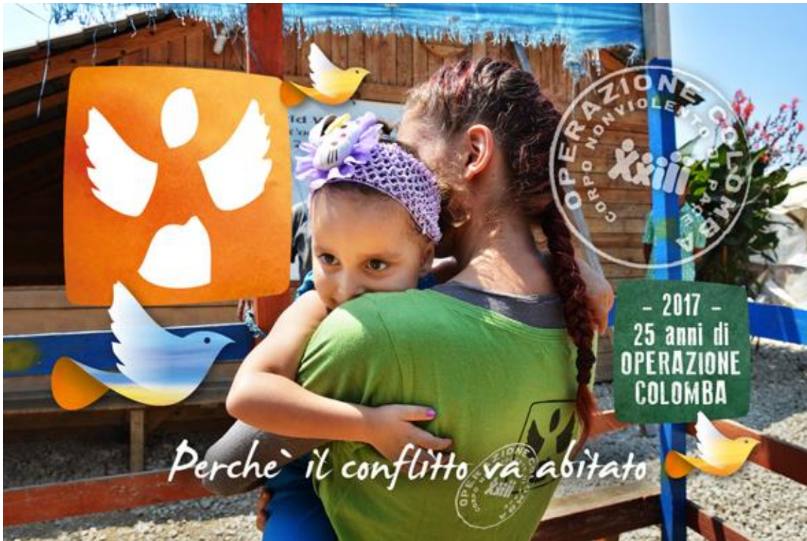
Foto 1 e 2 3 Operazione Colomba