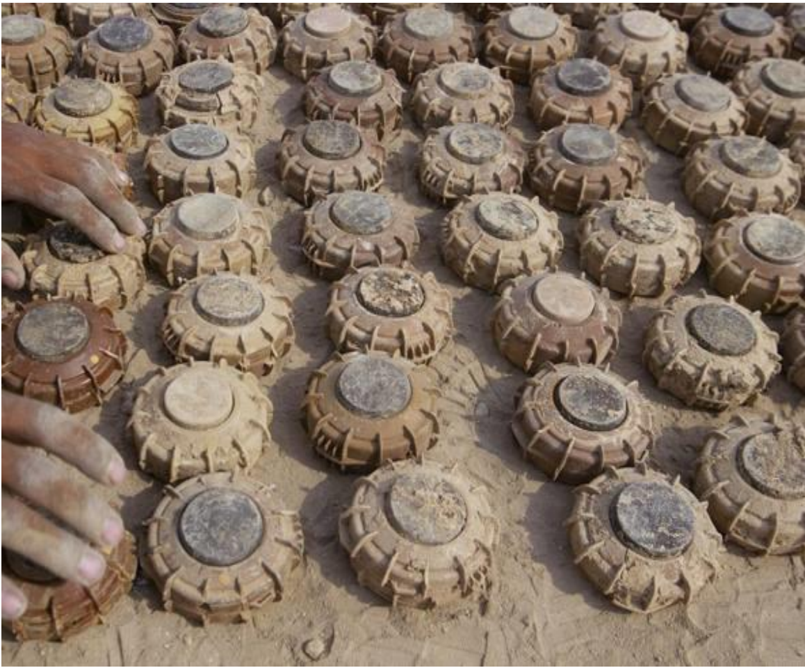
Foto 6. Mine