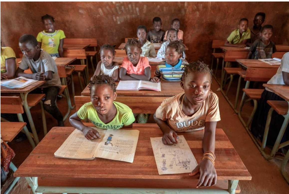
Foto 5 e 6. Scuole dei Missionari