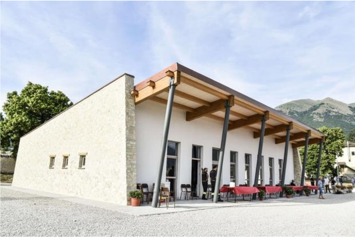
Centro comunità Caldarola