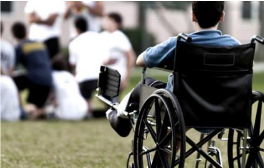
Foto 4.5.6. migranti