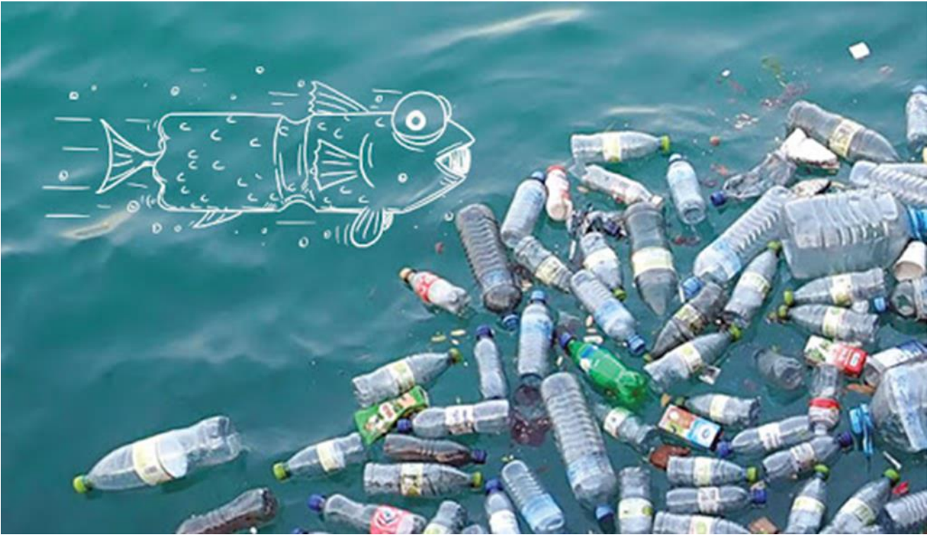
Foto 2. Raccolta plastica in spiaggia