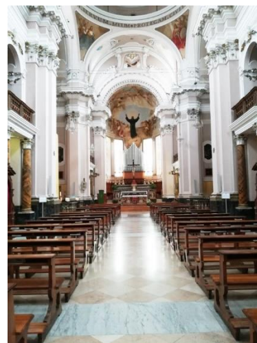
Basilica San Giuseppe da Copertino in Osimo (interno)

Il Santuario conserva nella Cripta, il corpo del Santo, meta di numerosi pellegrini e studenti che a lui si affidano e nelle Camerette, abitate dal Santo, diversi ricordi e tra questi, l'immagine della Madonna della Grottella da lui tanto amata e amabilmente chiamata " Mamma mia ". Dinanzi a questa immagine, questa sera preghiamo il Rosario per l'Italia, affidandoci all'intercessione della Madonna della Grottella e a quella del nostro caro santo, Giuseppe da Copertino, patrono della Città di Osimo.