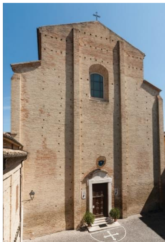
Basilica San Giuseppe da Copertino in Osimo (facciata)