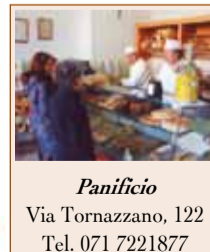
Panificio Via Tornazzano, 122 Tel. 071 7221877