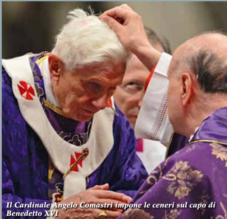
Il Cardinale Angelo Comastri impone le ceneri sul capo di Benedetto XVI