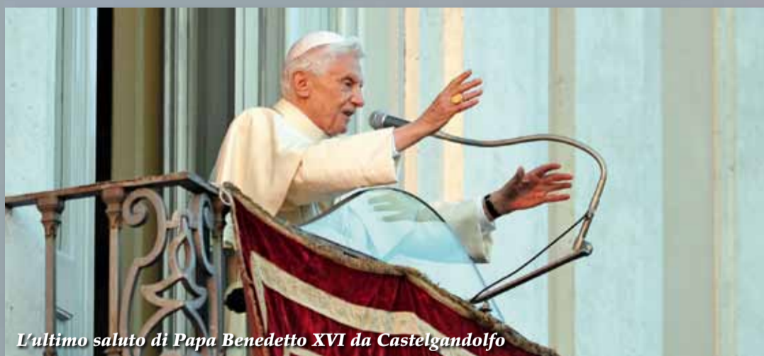
L'ultimo saluto di Papa Benedetto XVI da Castelgandolfo

Pane e dolci - Pasticceria e colazioni da bar - Rinfreschi e torte per cerimonie Orzo da caffè - Mezzi tecnici per l'agricoltura - Assistenza tecnica - Isola ecologica