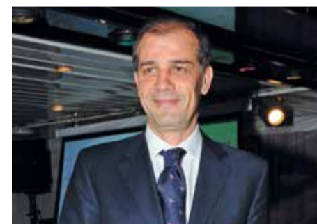
Rossi in occasione dell'incontro prenatalizio

Fin qui l'attacco di un articolo sul Corriere della Sera, di Cesare Zappieri, il 12 marzo. Poi se n'è parlato in