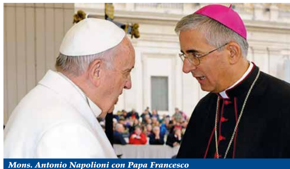
Mons. Antonio Napolioni con Papa Francesco

Quello di riscoprire la presenza del Signore, molto più potente, fedele e capillare delle forme a cui noi siamo abituati.