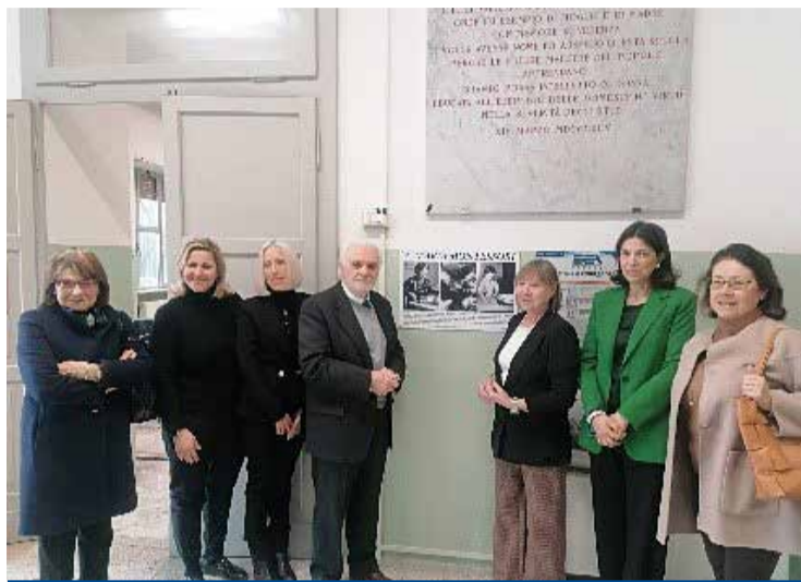
Il momento della svelatura della targa

mantiene la memoria dei temi e dei personaggi così legati alla nostra terra, che tanto hanno dato alla cultura del nostro Paese".