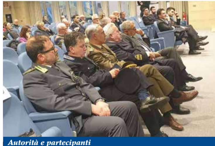
Autorità e partecipanti

coinvolgere i giovani nelle azioni politiche. Occorre un rinnovamento in senso comunitario. Il quartiere, il paese, la città sono luoghi dove si verifica la vicinanza o l'abbandono. Prima di ogni riforma istituzionale bisognerebbe mettere mano alla qualità relazionale di un territorio. Papa Francesco lo spiega così: “Ai problemi sociali si risponde con reti comunitarie” (LS 219). Don Primo Mazzolari scriveva ai politici eletti al Parlamento nel 1948: “Siate grandi come la povertà che rappresentate”. Le disuguaglianze sociali in cui vivono molte persone meriterebbero la migliore politica: disoccupati, sottoccupati e precari; giovani che studiano, Neet (Not in Education, Em-