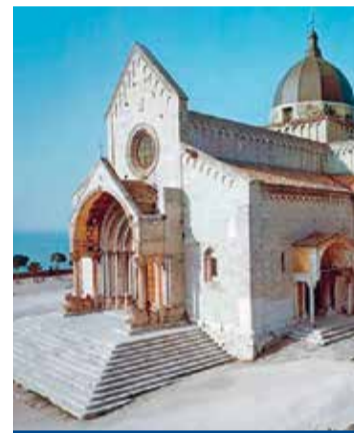
Cattedrale di Ancona

Come sono diverse le due cattedrali! Gotico tedesco che si concretizza in un’elaborata pietra scura quella di Freiburg, gotico bizantino, un volo di pietra bianca che