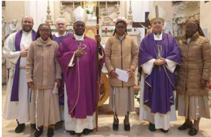
Concelebranti e suore

profondamente il cuore dell'uomo, come diceva bene Sant'Agostino: "Ci hai creati per te, Signore, e il nostro cuore è inquieto finché non riposa in Te". Sì, nessuna creatura può essere tutta la nostra vita: né il padre, né la madre, né il marito, né la moglie. Ti invito a fare tua oggi questa esortazione di Papa San Giovanni Paolo II alle persone consacrate: "Guarda al passato con gratitudine, vivi il presente con passione essendo uomini e donne di comunione, presenti con coraggio dove ci sono disparità e tensioni, essendo segni credibili della presenza dello Spirito che infonde passione nei cuori perché tutti siano una cosa sola e abbracciare il futuro con speranza". È seguito il rito della professione. Dopo aver risposto alle domande del Vescovo e aver pronunciato "Sì, lo voglio", suor Lucia si è prostrata a terra e sono state intonate le litanie. La suora, inginocchiata poi davanti a Mons. Jean Pierre Kwambamba, ponendo le sue mani in quelle del Vescovo, ha letto la formula della professione scritta di proprio pugno. Ha poi deposto sull'altare il foglio con la formula di professione e lo ha firmato. Anche suor Madelaine, Mons. Jean Pierre Kwambamba e Mons. Angelo Spina hanno messo la propria firma. Continua a pagina 14