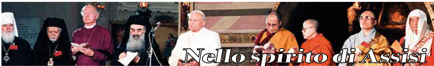
Nello spirito di Assisi

Tuttavia l'impennata è riuscita solamente a recuperare la distanza con il 2019. Nell'anno pre-pandemico il numero dei matrimoni era stato 184mila. Così si conferma la decrescita continuativa che da oltre un decennio si realizza nel Paese. La diminuzione - è utile ricordarlo - è un effetto del calo del numero complessivo della popolazione giovanile, tra di loro - in passato almeno - si trovavano le persone che più facilmente convolavano a nozze. Lo osserviamo quando l'Istat confronta il numero dei primi matrimoni: nel 2019 erano stati 146mila nel 2021 sono stati 142mila, la differenza nel computo dei matrimoni totali è tutta lì. A.C. agensis