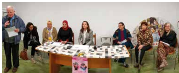
Le protagoniste della serata con P. Gianfranco

catechiste, come infermiere o insegnanti. L'incontro è stato interessante per il pubblico che riempiva la sala, perché rompeva il ghiaccio della diffidenza fra queste due grandi religioni che caratterizzano la nostra società, mettendo in evidenza i pregiudizi che dividono e alimentano le paure. È stata una serata che ha manifestato la volontà di costruire insieme nell'oggi quella FRATERNITÀ UNIVERSALE che Papa Francesco auspica nel futuro della nostra società. P.G.S.