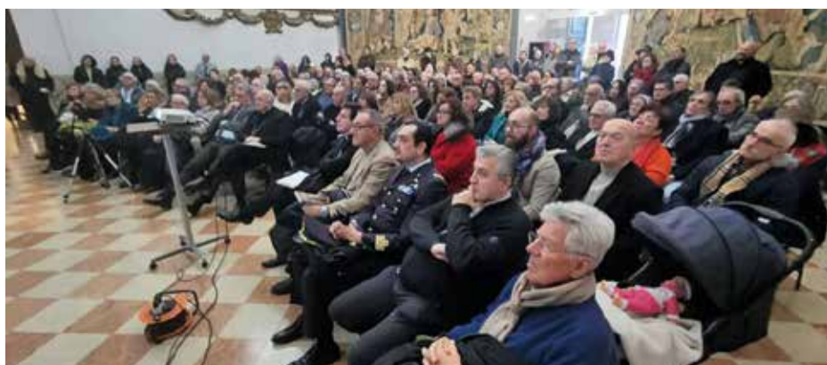
I partecipanti alla presentazione

quella di Loreto è la Casa dove si compì il mistero dell'incarnazione di Gesù: dall'apparato architettonico che la accosta a una casa, piuttosto che a una chiesa, alle irrazionalità edilizie, dai segni a spina di pesce impressi sulle pietre che trovano preciso riscontro con i segni nabatei della Palestina, ai graffiti che, come diceva il cardinale Palazzini, sono il "marchio di origine" delle pietre della Santa Casa di Loreto. Si tratta di simboli con una precisa valenza cristologica che trovano confronto solo con i segni dei cosiddetti giudeo-cristiani della Terra Santa.